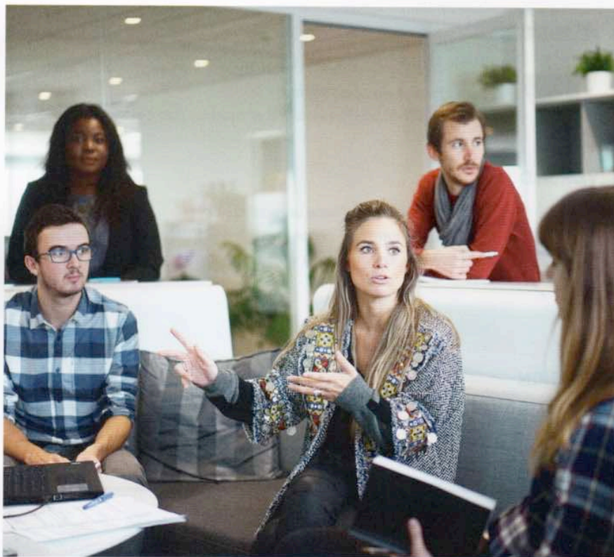
Eigenbetriebe von Kommunen können gemeinsam mit Mitarbeitern ein Leitbild unter dem Aspekt der Gemeinwohlorientierung entwickeln.

Sehr deutlich wurde damit, dass die Gemeinwohl-Bilanz als Orientierungsrahmen gerade auf der kommunalen Ebene einen wertvollen Beitrag leisten kann,